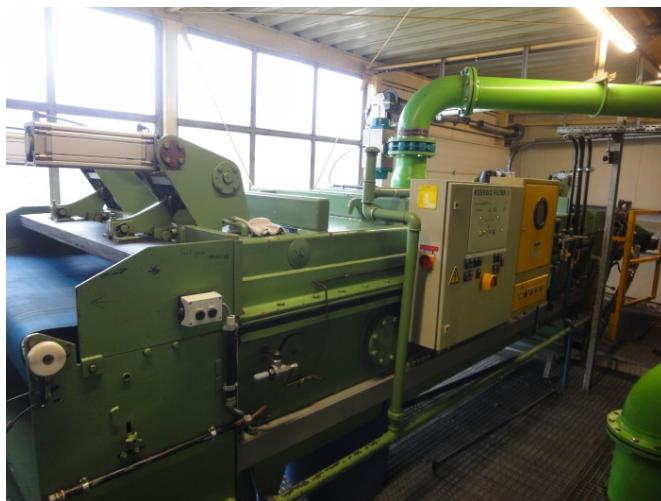
Bild 3: In der Zentralfilteranlage zur Fertigung von Wälzlager- und Hightech-Komponenten bei Schaeffler in Schweinfurt ersetzt ein Polyesterfilterband vom Typ VACUBELT® 3354 der GKD das bisher eingesetzte Kunststoffband.

Bild 1-2 Bild 3-10