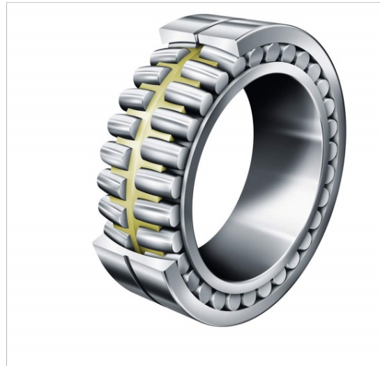
Bild 1-2: Ein Wälzlager besteht aus einem Außen- und einem Innenring, zwischen denen sich in einem Käfig Wälzkörper - zum Beispiel Kugeln, Zylinderrollen oder Tonnenrollen - auf Laufbahnen bewegen.

Bild 1-2 © Schaeffler Technologies AG & Co. KG Bild 3-10 © GKD