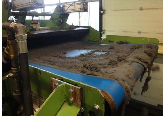
Bild 6: Die glatte Oberfläche der spezifischen Gewebekonstruktion aus Polyestermonofilamenten gewährleistet einen guten Kuchenabwurf.