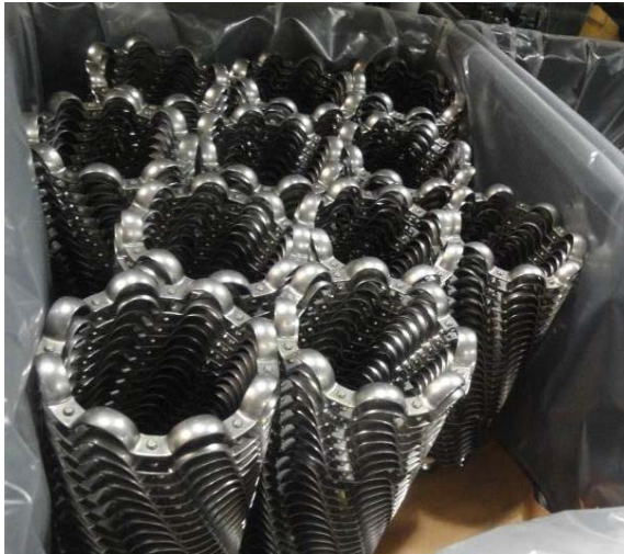
Bild 9: Der Käfig hält die Rollkörper auf gleichem Abstand und verhindert so, dass sie sich berühren.