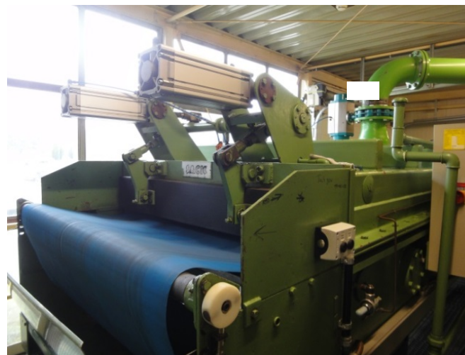
Bild 4: Mit einer deutlich besseren Haltbarkeit, Stabilität und Standzeit erschloss der neue Bandtyp von GKD bei Schaeffler eine signifikant höhere Versorgungs- und Prozesssicherheit.