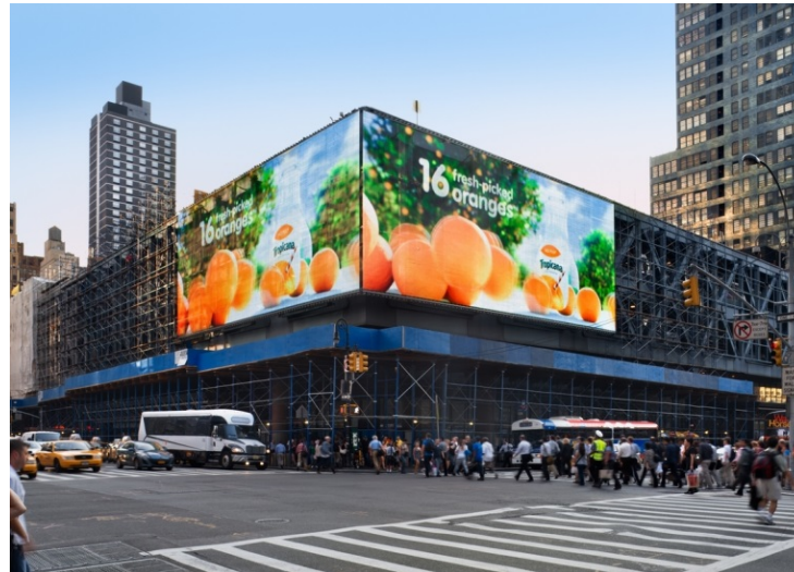
Bild 8: Das transparente Medienfassadensystem Mediamesh aus Metallgewebe – hier am Port Authority Busbahnhof mitten in New York.