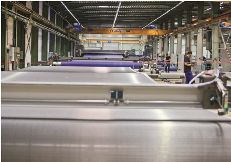
Bild 3-4: Mit smarten Produkten aus Metall- und Hybridgeweben erschließt GKD Anwendern und Anlagenbauern bislang unbekannte Möglichkeiten.