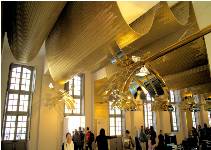
Bild 7: Architekturgewebe des Weltmarktführers verleihen u.a. dem neuen Eingangsbereich von Schloss Versailles in Paris sein unverwechselbares Gesicht.