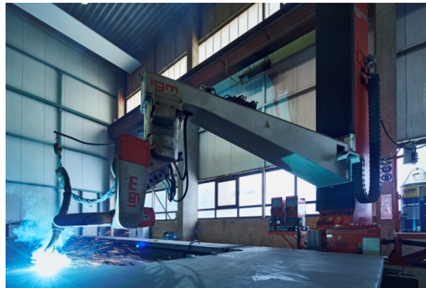
Bild 2: Bei mehrlagigem Schweißen gibt der Einsatz von Schweißrobotern Kran-Kunden die Gewissheit absolut präziser, reproduzierbarer Schweißnähte.