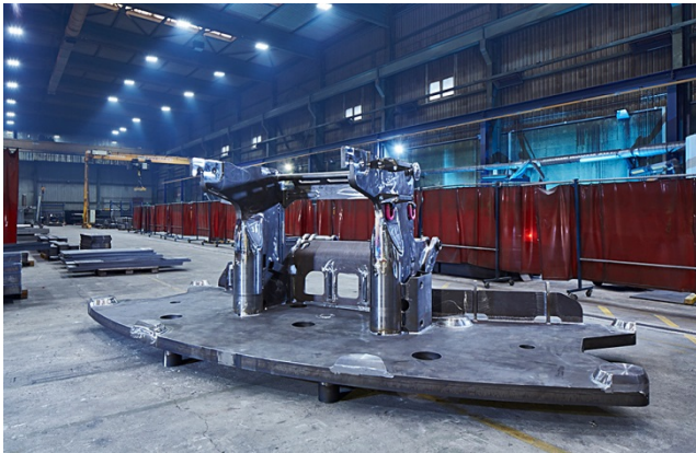
Bild 1: Eine entscheidende Rolle für die Stabilität von Kranen spielt naturgemäß die Grundplatte. Sie wird von der Jebens GmbH geschnitten und zur fertigen Baugruppe verarbeitet.