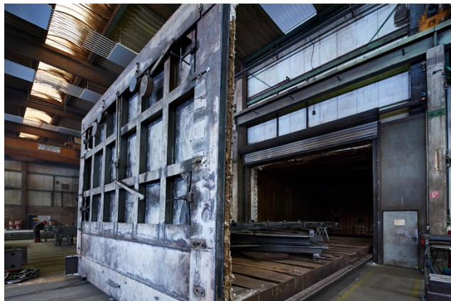
Bild 3: In einem der größten Glühöfen Süddeutschlands werden Großbauteile mit Stückgewichten bis zu 160 Tonnen optimal auf ihren weiteren Einsatz vorbereitet.