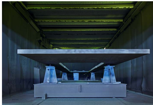
Bild 4: Als Komplettanbieter komplexer Schweißbaugruppen und Großteile ist Jebens für Großanlagenhersteller ein echt starker Zukunftspartner.

Gerne senden wir Ihnen diese oder weitere Motive in druckfähiger Auflösung per E-Mail.