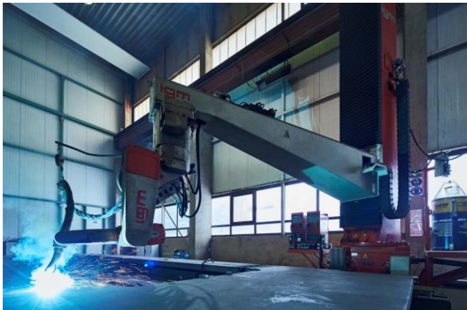
Bild 3: Der Einsatz des Schweißroboters gewährleistete bei mehrlagigem Schweißen mit absolut gleichmäßigen und fehlerfreien Schweißnähten die geforderte Nahtpräzision.