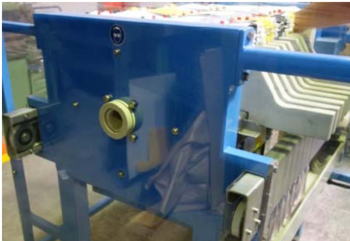
Bild 7: Zuführung für die Suspension an einer Filox-Filterpresse.