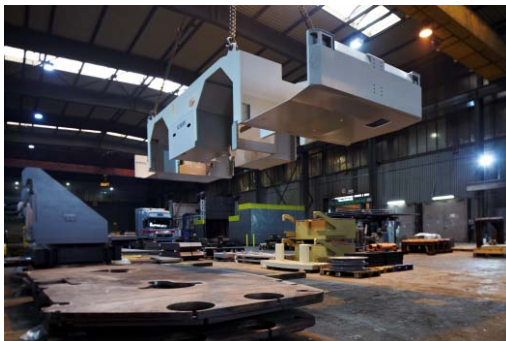
Bild 3: Bis zu 30 Tonnen schwere Elemente formen die robuste Rahmenkonstruktion der Flugzeugschlepper.

Das Bildmaterial darf ausschließlich für das hier genannte Thema der Jebens GmbH verwendet werden. Jede darüber hinausgehende, insbesondere firmenfremde Nutzung, wird ausdrücklich untersagt.