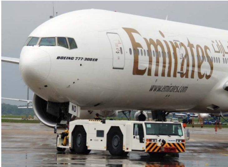
Bild 1: Vor dem Fliegen kommt das Schieben: Alltag auf dem Flughafenvorfeld