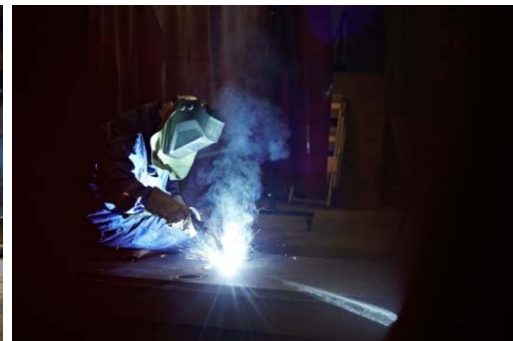
Bild 4: Die notwendige Effizienz der Fertigung bei Jebens liefert ein großer Drehtisch, auf dem der Rahmen in allen Lagen geschweißt werden kann.