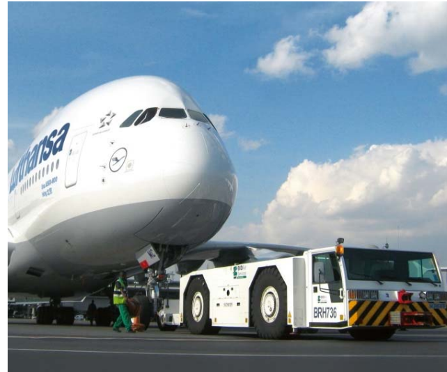
Bild 2: Das Manövrieren der bis zu 600 Tonnen schweren Flugzeuge ist ein enormer Kraftakt für die Schlepper.