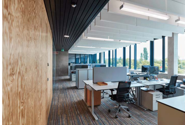
Bild 2: Durch die hochwertige Drucktechnik der designstarken Bodenbeläge von TOUCAN-T erzeugt das grafische Muster wohnliche Behaglichkeit.