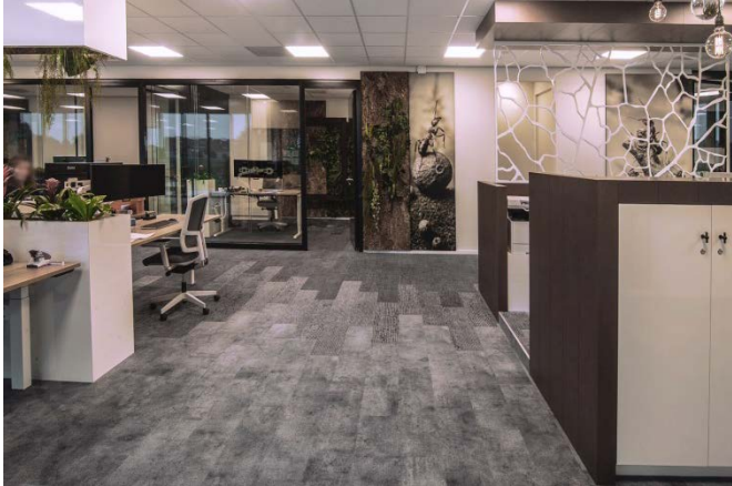
Bild 5: Weiche Haptik, raue Optik: Der Look von verwittertem Stein, gealtertem Holz und Streifendesign verleiht dem textilen Bodenbelag von TOUCAN-T eine rustikale Lebendigkeit.