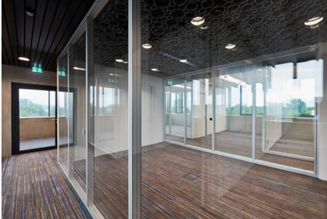
Bild 1: Zur raumakustischen Optimierung der vielen schallharten Oberflächen wählten die Planer von Linde Hydraulics in Aschaffenburg die textilen Designplanken PLANKX by TOUCAN-T .