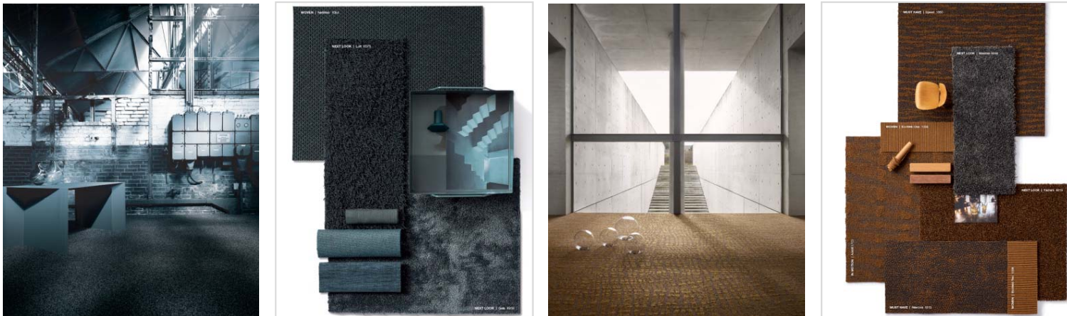
Bild 5-6: Das Thema MONOCHROME in CROSS THE GAP spielt mit Farbschattierungen wie hier in mystic petrol .

Das Bildmaterial darf ausschließlich für den hier genannten Text der TOUCAN-T Carpet Manufacture GmbH verwendet werden. Jede darüber hinausgehende, insbesondere firmenfremde Nutzung wird ausdrücklich untersagt.