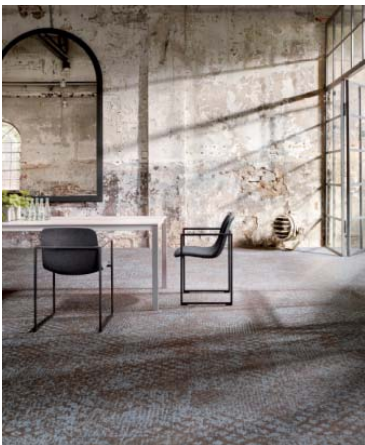
Bild 13-14: Mit Themen wie nordic escape überrascht INTER COSY mit Kombinationsideen aus zurückhaltenden Farben und expressiven Texturen.

Das Bildmaterial darf ausschließlich für den hier genannten Text der TOUCAN-T Carpet Manufacture GmbH verwendet werden. Jede darüber hinausgehende, insbesondere firmenfremde Nutzung wird ausdrücklich untersagt.