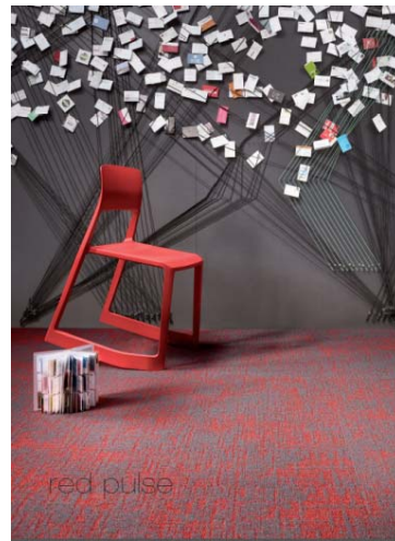
Bild 11-12: POP ART schafft mit Moods wie red pulse spielerische Spannung.