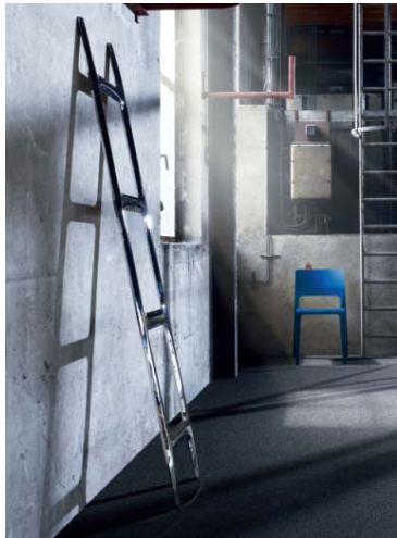
Bild 9-10: Mit Vorschlägen wie silent mood paart BLACK & WHITE cooles Understatement mit fröhlichen Farbkleksen.