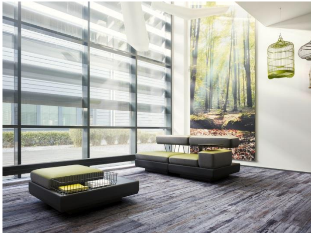
Bild 1: Die innovative Konstruktion der PLANKX by TOUCAN-T vereint die Vorteile textiler Bodenbeläge mit der Ausdruckskraft von Designböden.