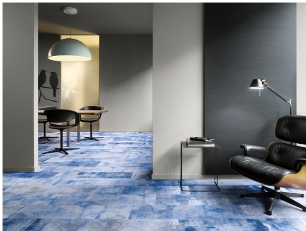
Bild 3-4: Auch bei nicht orthogonalen Raumstrukturen können die textilen Designplanken mit minimalem Verschnitt schnell verlegt werden.