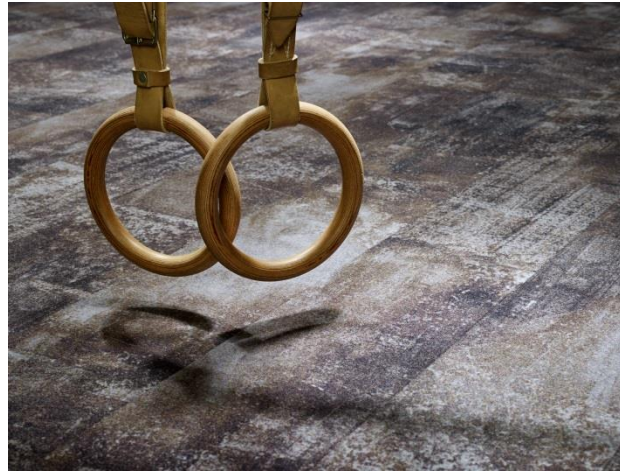
Bild 5-6: Durch 30 expressive Dessins in 50 Farbstellungen erschließen die textilen Designplanken die ganze Bandbreite authentischer Industriebodenoptiken.