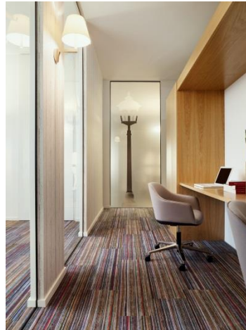
Bild 2: Die designstarken Bodenbeläge von TOUCAN-T verbinden robuste Belastbarkeit mit hohem Gehkomfort, raumakustischer Optimierung und attraktiver Ästhetik.