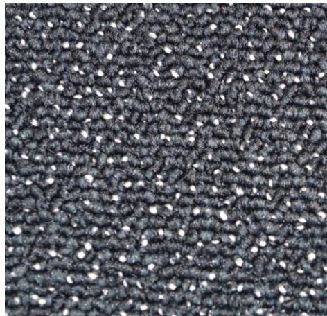
Bild 7: Punktuell eingearbeitetes Effektgarn in Metalloptik gibt der Schlingenware Stream ihre faszinierende optische Tiefe.