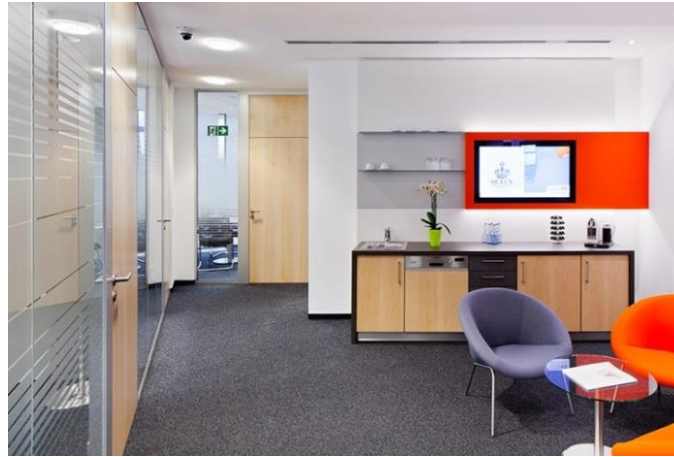
Bild 6: Für akustische Raumqualität in Beratungsbereichen und Minilounge sorgt der großzügige Einsatz von TOUCAN-T Teppichboden.