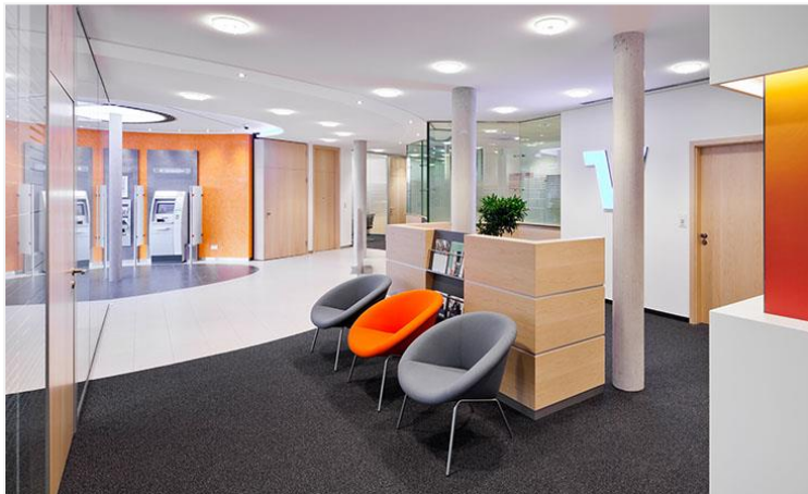
Bild 3: Neben Feinstein prägt vor allem Teppichboden das moderne, wertige Erscheinungsbild.