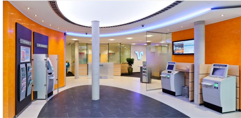
Bild 2: Das offene Innenraumkonzept wird von einem großzügigen Foyer dominiert, das SB-Bereich und Service verbindet.