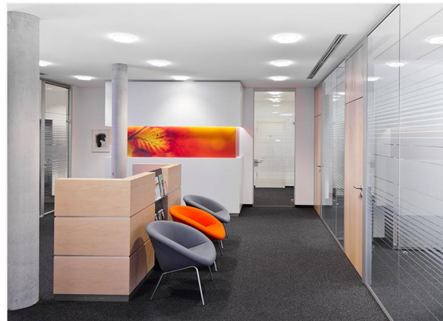
Bild 4: Das unsichtbare Nahtbild unterstreicht die Ruhe des übergreifenden Raumkonzeptes.